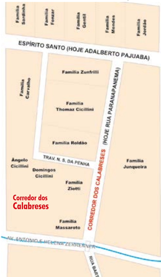
ARTE FERNANDO BRAGA / BASEADO EM INDICAÇÕES DE ANNIBAL CICILLINI