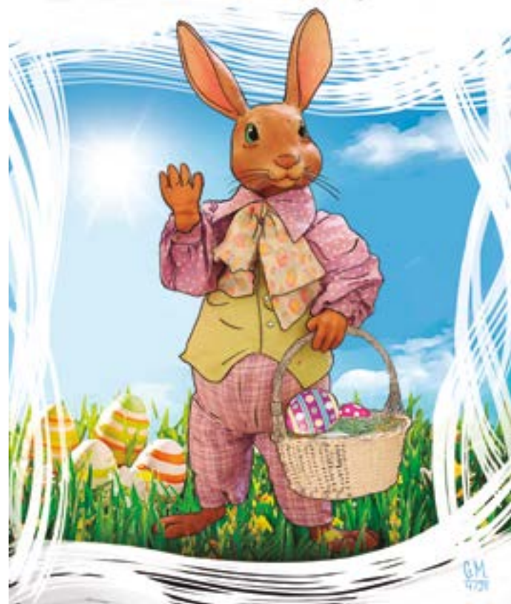
ILUSTRAÇÃO GUSTAVO MANIEZI

P áscoa ou Domingo da Ressurreição é uma festividade religiosa que celebra a ressurreição de Jesus ocorrida ao terceiro dia após sua crucificação no Calvário, conforme o relato do Novo Testamento. É a principal celebração do ano litúrgico cristão e a mais antiga e importante festa cristã. É comemorada sempre no primeiro domingo após a lua cheia ocorrida com o fim do equinócio de primavera/outono.