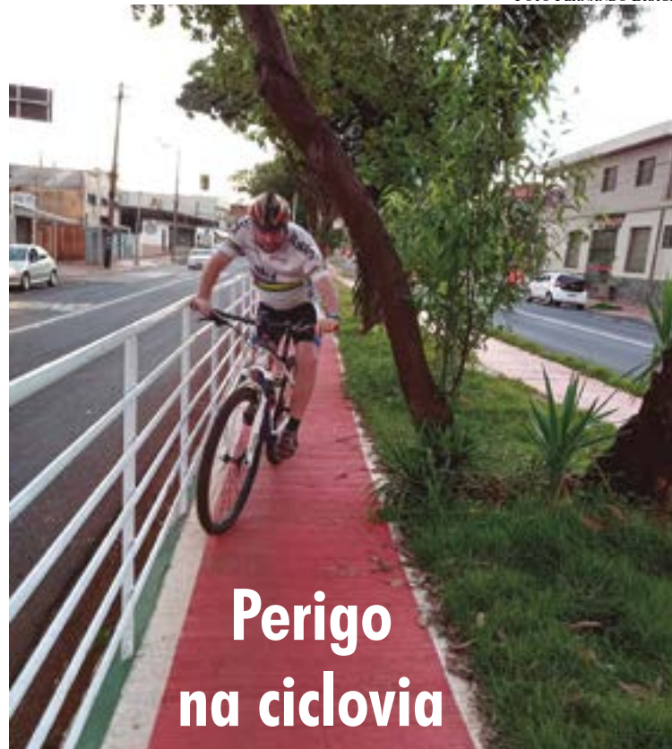
Árvore na Ciclovia do Café, altura do nº 445, coloca ciclistas em perigo

Os pedestres também foram beneficiados nesta obra. Praticamente todo o passeio da avenida foi revitalizado para garantir acessibilidade, principalmente àqueles com dificuldades de mobilidade. Todas as esquinas da via passaram a contar com rampas de acesso para cadeirantes, com piso tátil direcional e de alerta, indicando os pontos de espera e de travessia.