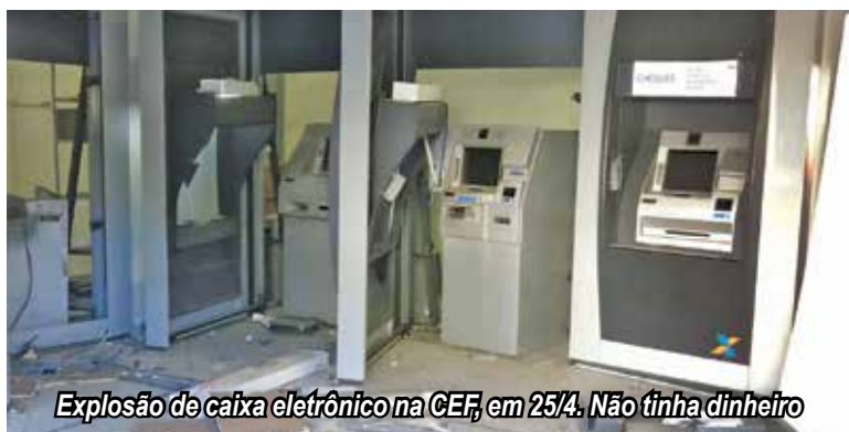
Explosão de caixa eletrônico na CEF, em 25/4. Não tinha dinheiro