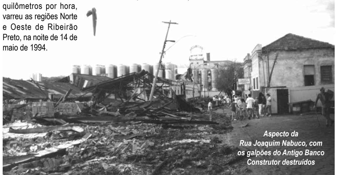
Aspecto da Rua Joaquim Nabuco, com os galpões do Antigo Banco Construtor destruídos

Tês mortes, dezenas de feridos, centenas de casas destelhadas, árvores derrubadas ou comprometidas, carros danificados. Este foi o saldo daquela noite de sábado. O domingo amanheceu com o tempo tranquilo, mas, as cenas de destruição eram vistas por toda a cidade