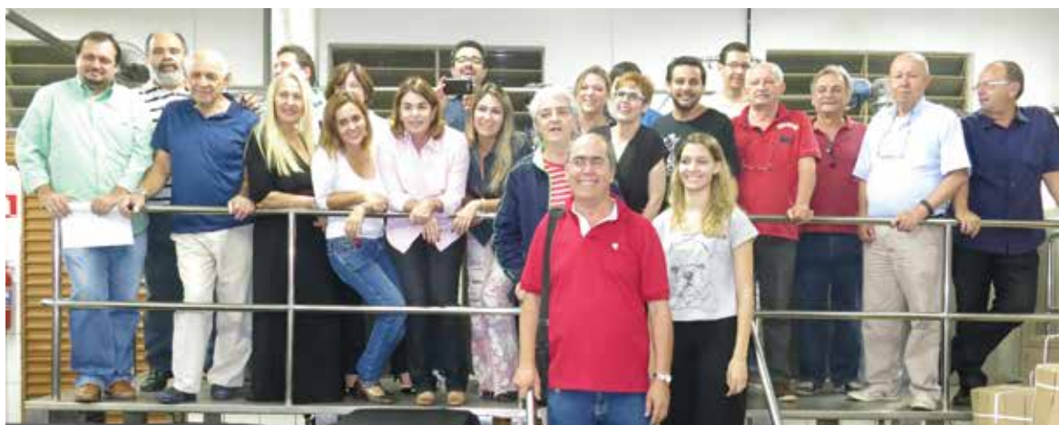
ENCONTRO DE JORNALISTAS NA CERVEJARIA INVICTA - Membros da Confraria 'Parem As Rotativas' prestigiaram o lançamento oficial do Slow Brew Brasil - Festival de Cervejas Artesanais que acontecerá em Ribeirão Preto em 1 e 2 de novembro de 2014.