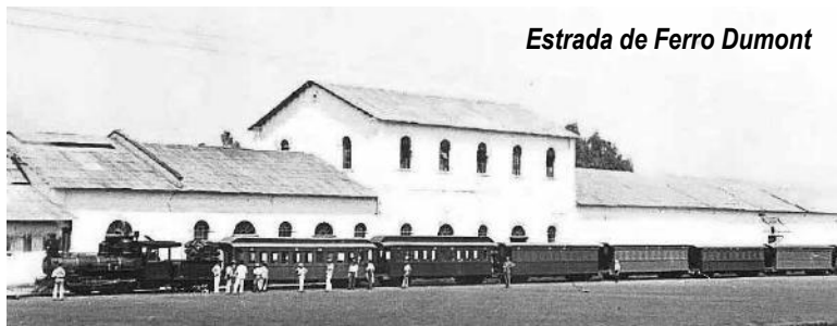
Estrada de Ferro Dumont