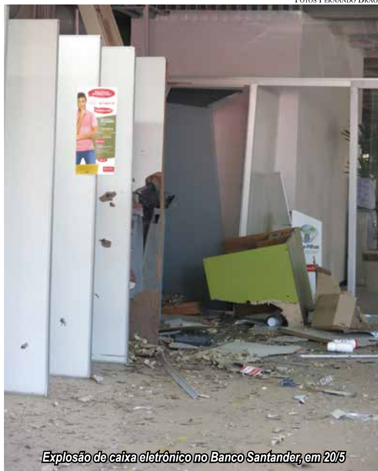
Explosão de caixa eletrônico no Banco Santander, em 20/5

No assalto a esta agência do Banco do Brasil, no dia 19 de fevereiro, o bandido alvejaram uma câmera de monitoramento que estava instalada na esquina do Banco Santander e até agora, três meses depois, a Coderp ainda acabou o conserto.