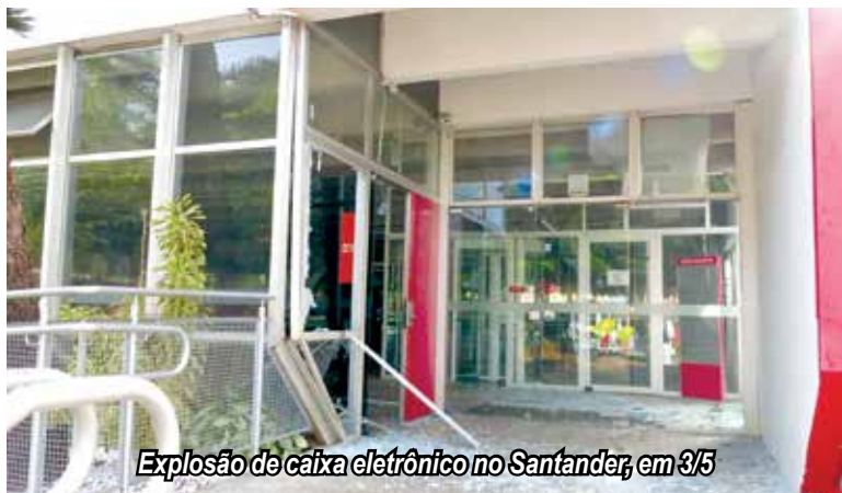
Explosão de caixa eletrônico no Santander, em 3/5

Parece a mesma notícia, mas, infelizmente não é! Bandidos explodiram caixa eletrônico na madrugada do dia 20 de maio na agência do Banco Santander, localizada na rua Rodrigues Alves, em frente à Praça Coração de Maria.