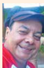
Balsa, dia 16