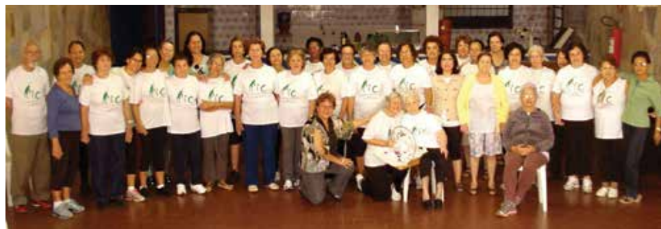
Comemoração dos Dia das Mães no PIC da Círculo Operário da Vila Tibério