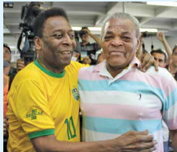
Pelé e Piter, considerado como um dos melhores marcadores do "Rei"