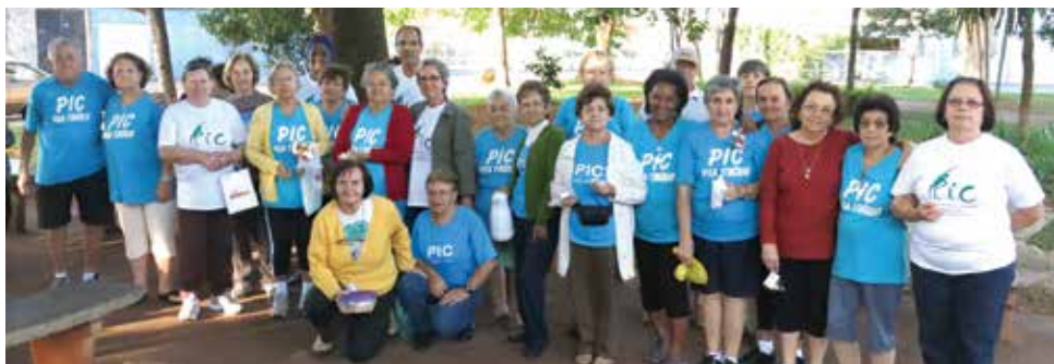
Comemoração dos Dia das Mães no PIC da Praça José Mortari