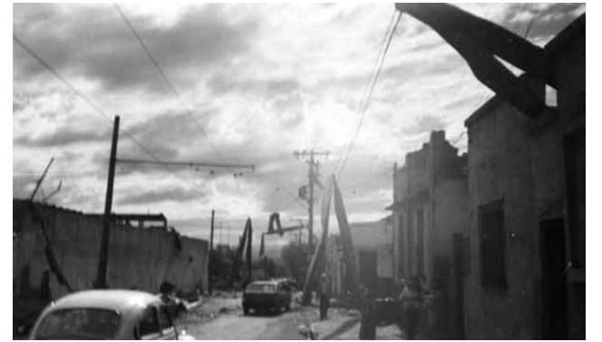
Prédio do Antigo Banco Construtor, na rua Joaquim Nabuco, hoje Lance Fiat. Na foto à direita, aspecto da rua Epitácio Pessoa na esquina com a Dr. Loyola e o muro do Poliesportivo