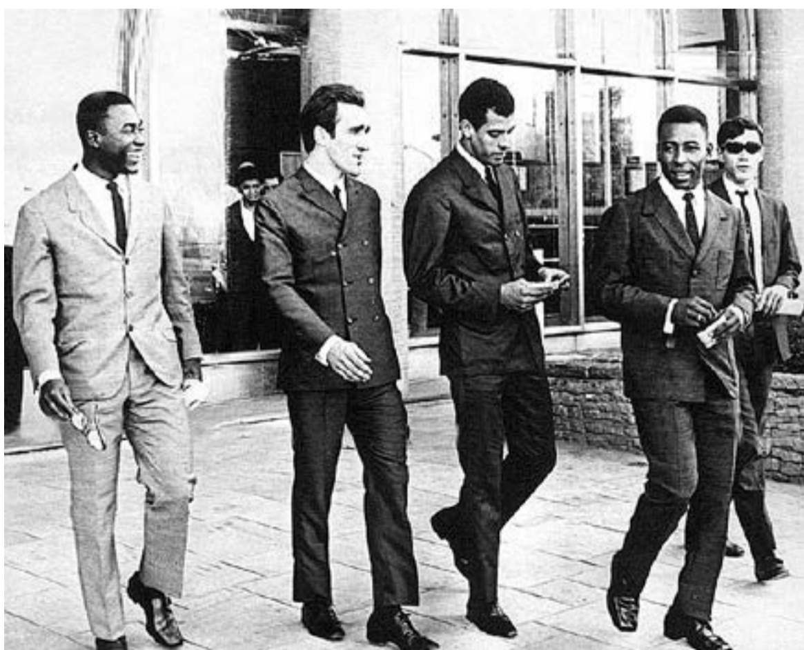
A elegância dos jogadores daquele timaço do Santos F.C. Na foto da esquerda para a direita: Edu, Toninho, Carlos Alberto, Pelé e Clodoaldo.