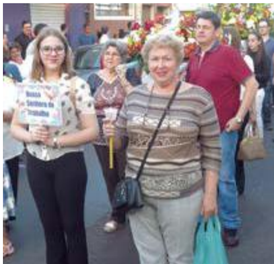
Família Palaretti carrega o andor de NS do Trabalho