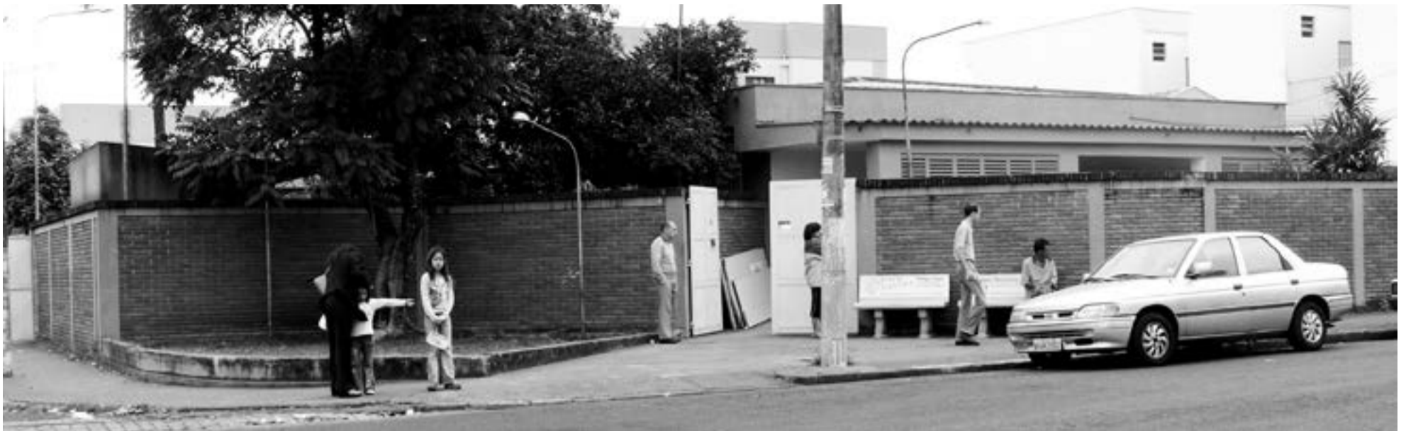
UBS Vila Tibério, na esquina das ruas Monte Alverne com 21 de Abril, antes da reforma de 2009/2010