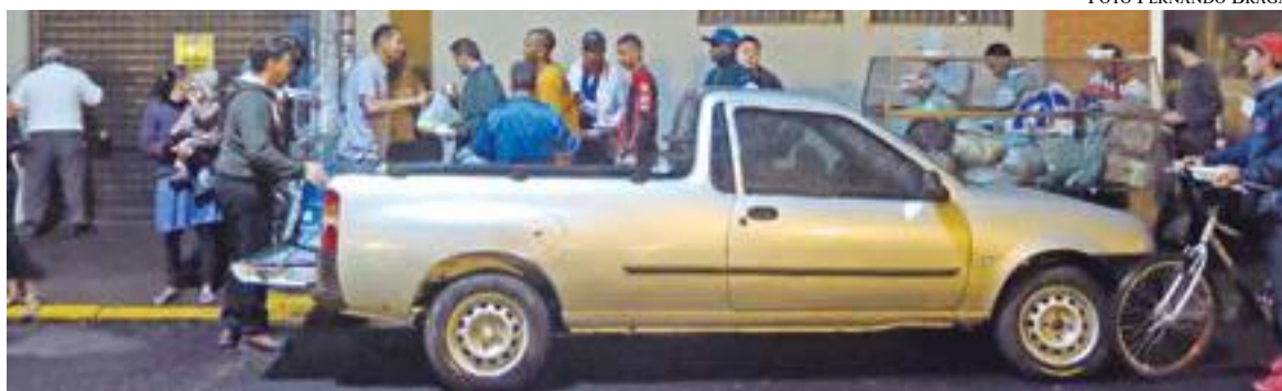
ONG distribui alimentos na Rua Augusto Severo, ao lado da Praça Francisco Schmidt