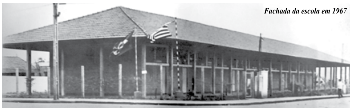
Fachada da escola em 1967

Os irmãos contentaram-se em fazer parte da corte e servir o novo rei.