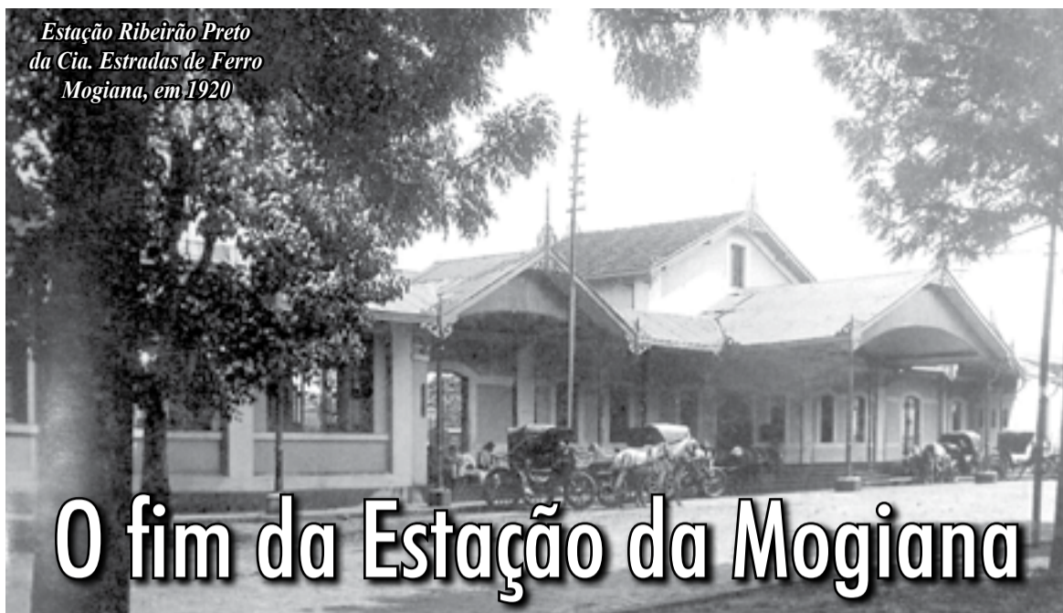
Estação Ribeirão Preto da Cia. Estradas de Ferro Mogiana, em 1920