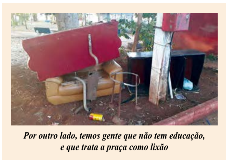
Por outro lado, temos gente que não tem educação, e que trata a praça como lixão