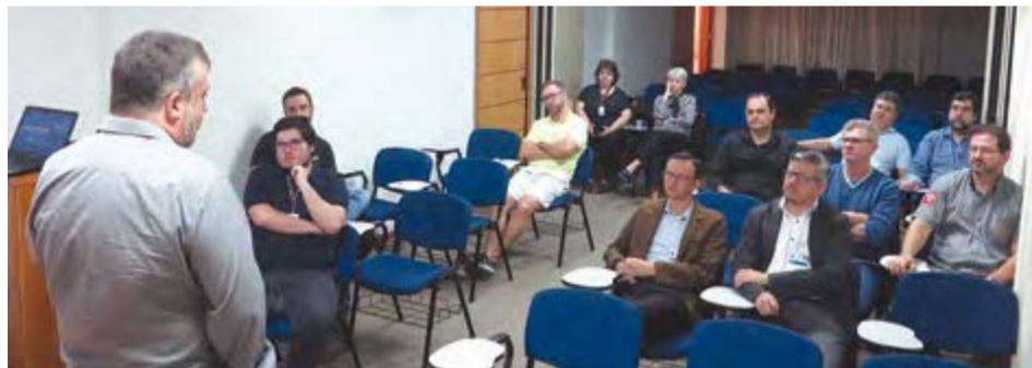
Reunião na sede da ACIRP com empresários e membros da USP