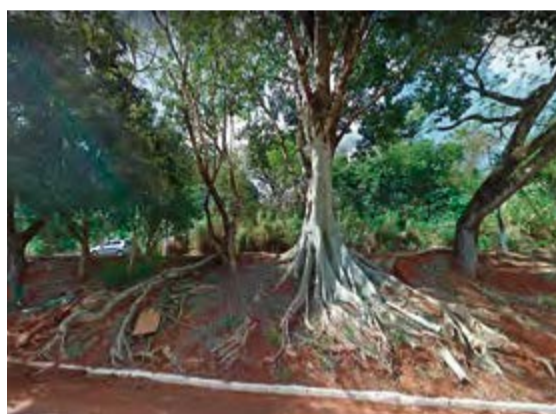
Árvores serão sacrificadas para instalação da ciclovia