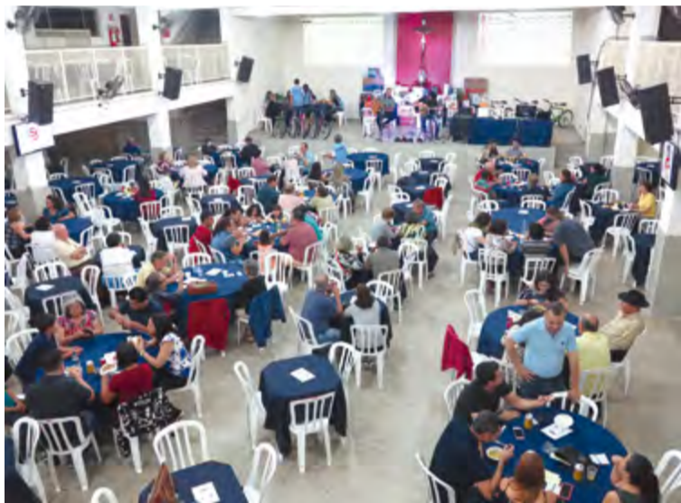
A tradicional Festa Quermesse, na Paróquia Santa Luzia, que aconteceu durante o mês de agosto