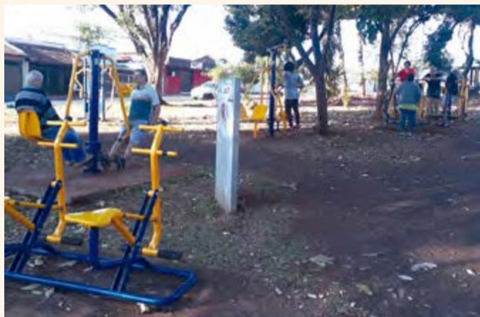
Academia de ginástica deixa a praça mais animada

"Com muito amor e dedicação", diz Luíza.