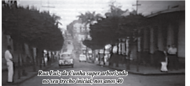
Rua Luiz da Cunha super arborizada no seu trecho inicial, nos anos 40