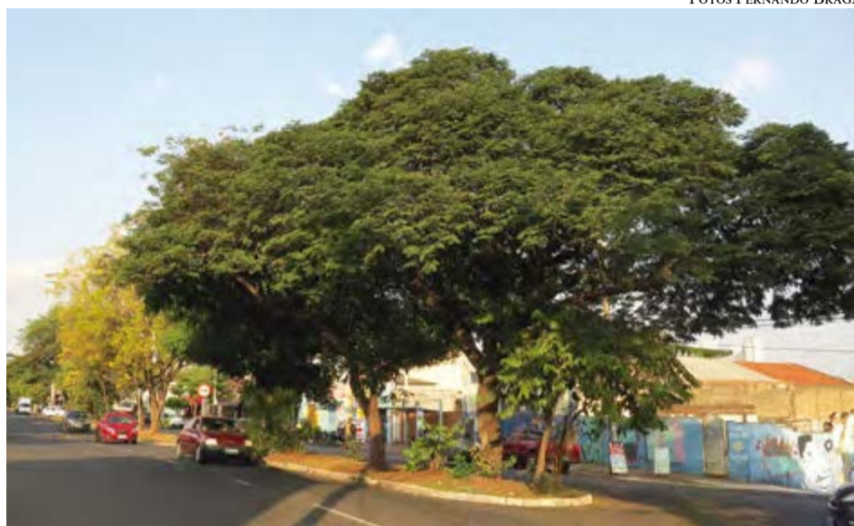
Com a ciclovia nos dois lados da ilha, muitas árvores podem ser sacrificadas. A Avenida tem mais de uma centena de grande e médio porte