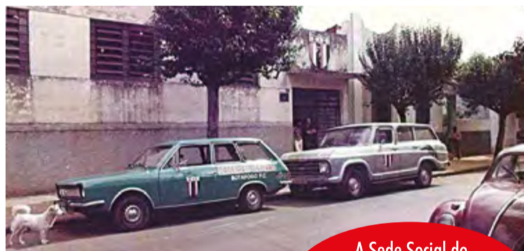
A Sede Social do Botafogo FC funcionou até 1981.