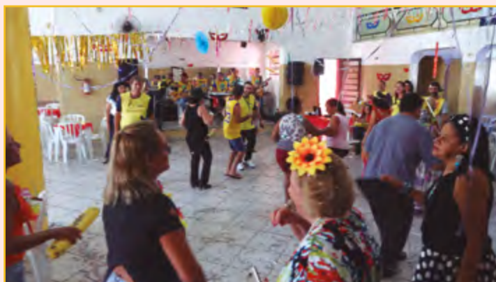
CARNAVAL VIDA PLENA - O Clube da Terceira Idade Vida Plena realizou sua festa de carnaval na antiga sede do Botafogo, na tarde de 25 de fevereiro.