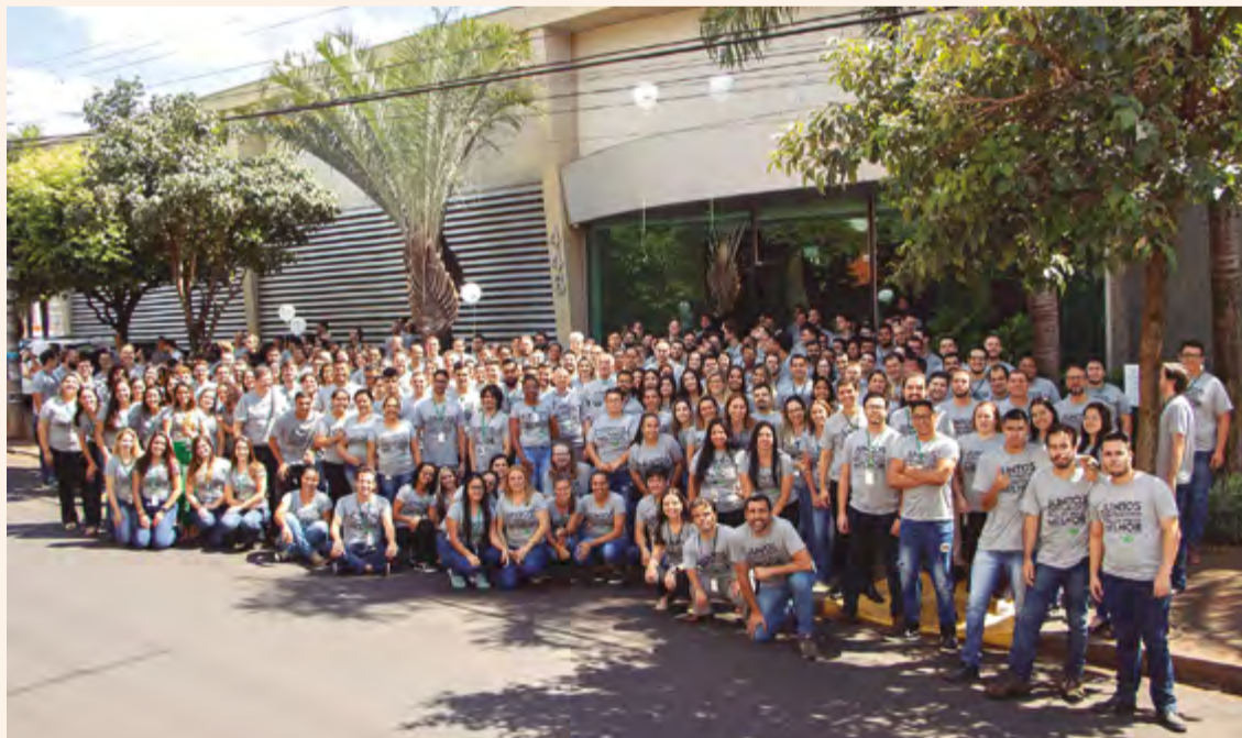
Colaboradores da SMARAPD celebraram, no dia 14 de fevereiro, os 40 anos de trabalho e desenvolvimento da empresa nas áreas de gestão pública e gestão de dados variados.