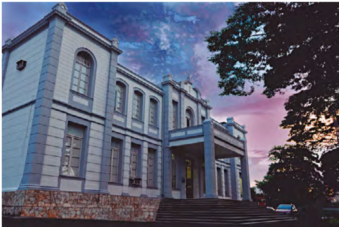
Faculdade de Medicina do Triângulo Mineiro, fundada em 27/4/1953