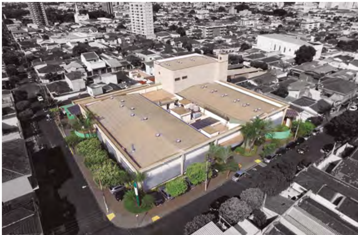
Sede da SMARAPD em Ribeirão Preto/SP, com 4mil m 2 de área construída

Construíram o Sistema de Contabilidade Pública e Gestão Orçamentária e o Sistema de Folha