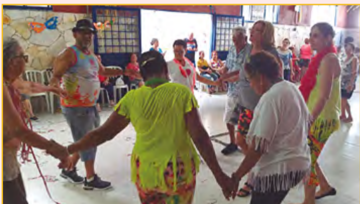
CARNAVAL NO CÍRCULO OPERÁRIO - a festa foi animada ao som de marchinhas na sexta-feira que antecede as festas de Momo, no dia 14 de fevereiro.

O maracatu de baque virado é caracterizado pelo uso de instrumentos de origem africana. Na percussão chamam atenção os grandes tambores, chamados alfaías, que são tocados com baquetas específicas. Estes dão o ritmo ou o baque da música e são acompanhados pelas caixas ou taróis, ganzás, abês e um gongô ou agogô.