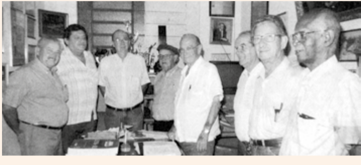
Visita ao jornal A Cidade em 2001

Os membros da Mesa da Velha Guarda Botafoguense estão se organizando para criar um museu com fotos, histórias, passagens interessantes e recortes de jornais e revistas. Na foto acima, reunião em outubro de 2019.