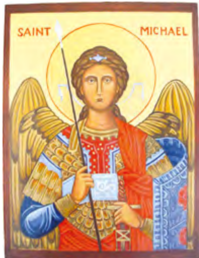
Acima, São Miguel Arcanjo (30x36cm) À esquerda, Nossa Senhora do Perpétuo Socorro (23x28cm) À direita, Jesus Bom Pastor (23x28cm)