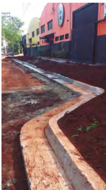
Calçadas terão recuo para estacionamento de veículos

Também estão sendo executadas as rampas de acessibilidade, guias, sarjetas, base e capa na