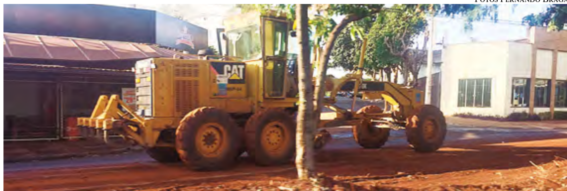
Trator nivela ilha da Avenida do Café para construção da ciclovia