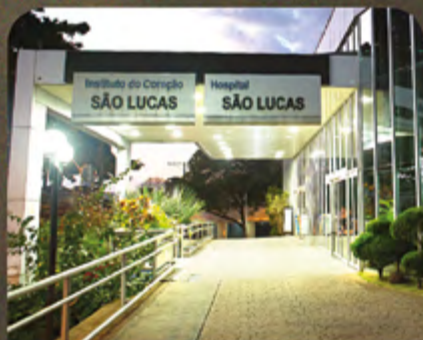
Hospital São Lucas

Conte conosco para retomar suas consultas, exames e cirurgias com SEGURANÇA .