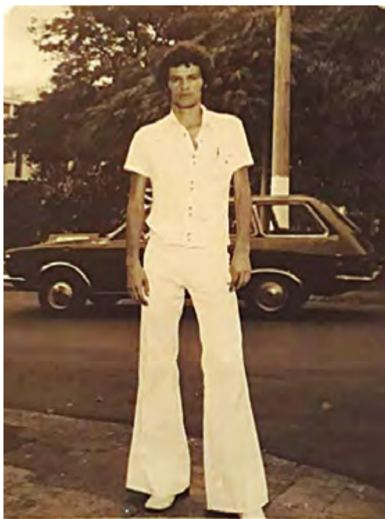
Sócrates, em São Joaquim da Barra