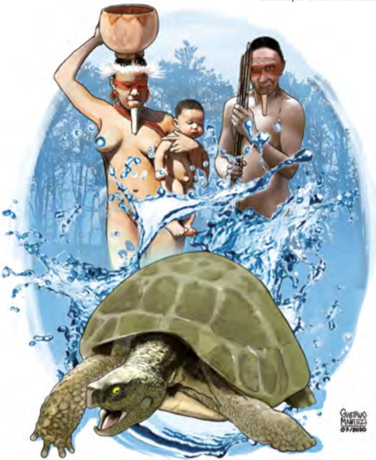
ILUSTRAÇÃO GUSTAVO MANIEZI

Essencial para todos os seres vivos na terra, a água é um bem comum a todos os povos. Sua preservação é responsável pela vida das plantas, dos animais e das pessoas. Você já deve ter lido que 70% do planeta Terra é feito de água.