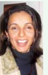
Wal, do Café Home Video, dia 20