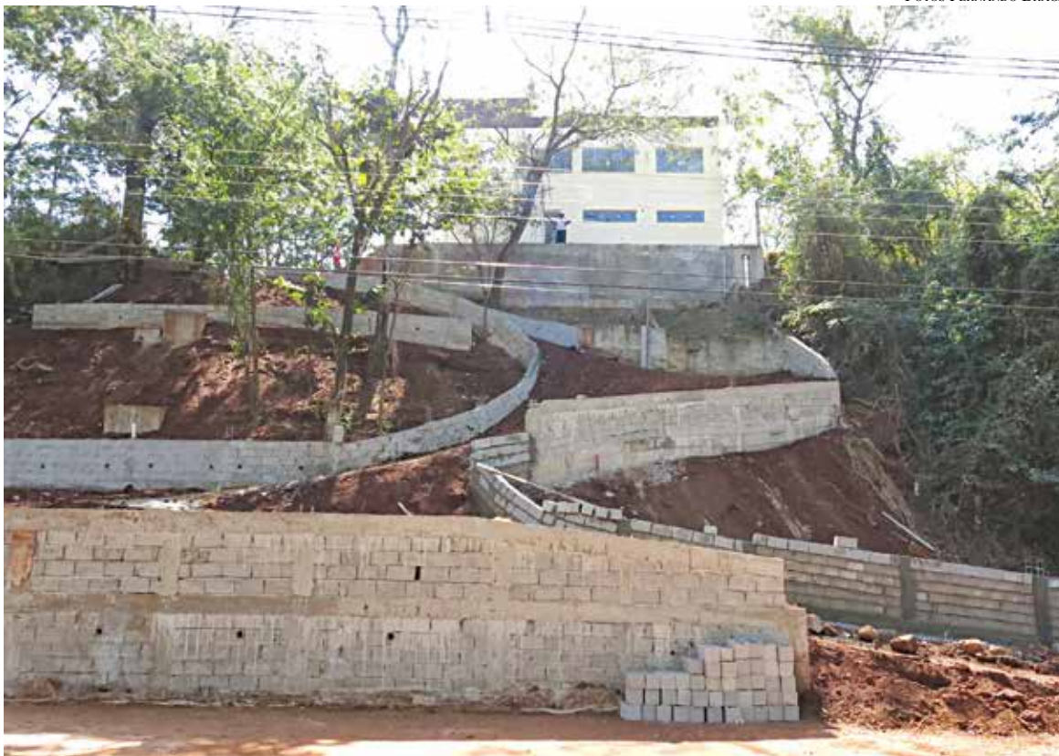
Rampas íngremes: árvores foram derrubadas para construção do acesso à construção

Aguardamos respostas para estas perguntas.