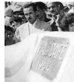
Descerramento da placa em 1954