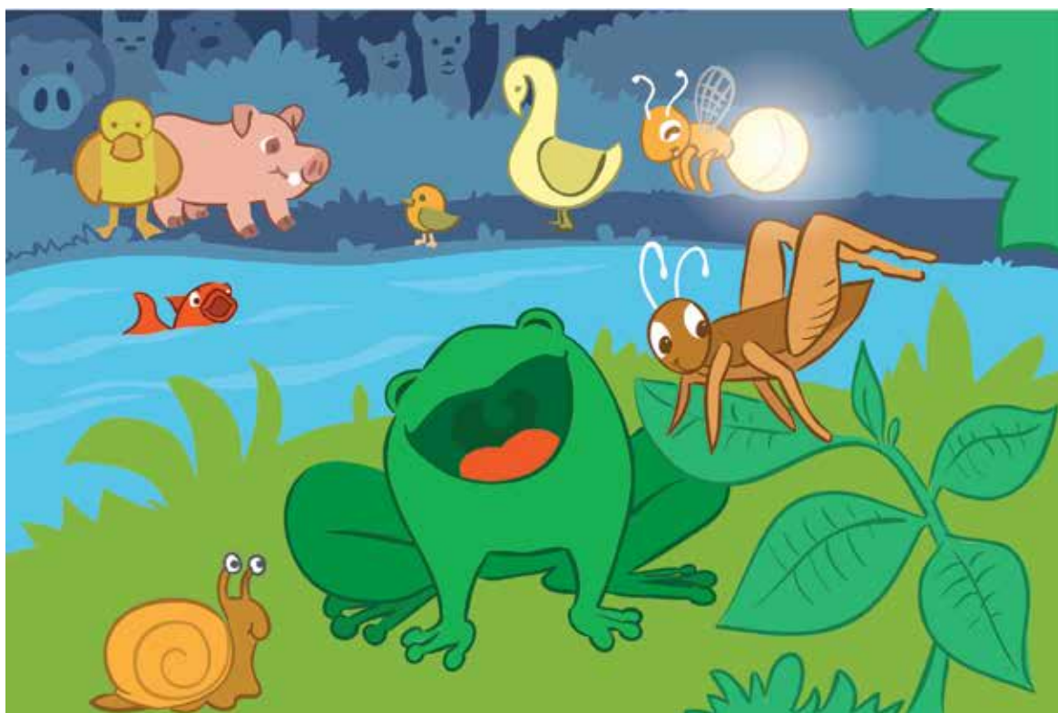
ILUSTRAÇÃO SAULO MICHELIN

E ra uma vez um grilo que vivia cantando pelos campos e matas de uma região muito bonita, cheias de morros e cachoeiras. Cantava durante todo o dia.