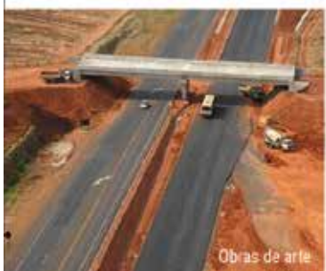
Obras de arte

Modernizando para continuar oferecendo qualidade, agilidade e pleno atendimento.