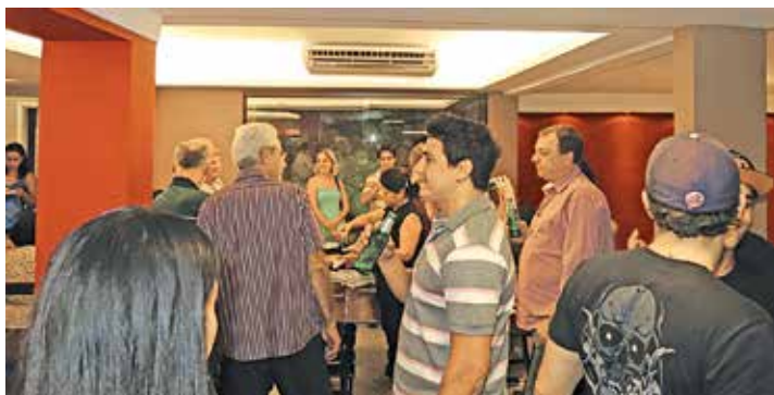
Momento da festa de inauguração

O Muraca San é a mais novo restaurante da Avenida do Café, especializado em comida japonesa, que como o Sr. Shiitake, faz parte do Grupo Muraca.