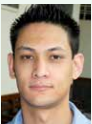
Roger, do Rodízio Gaúcho, dia 29