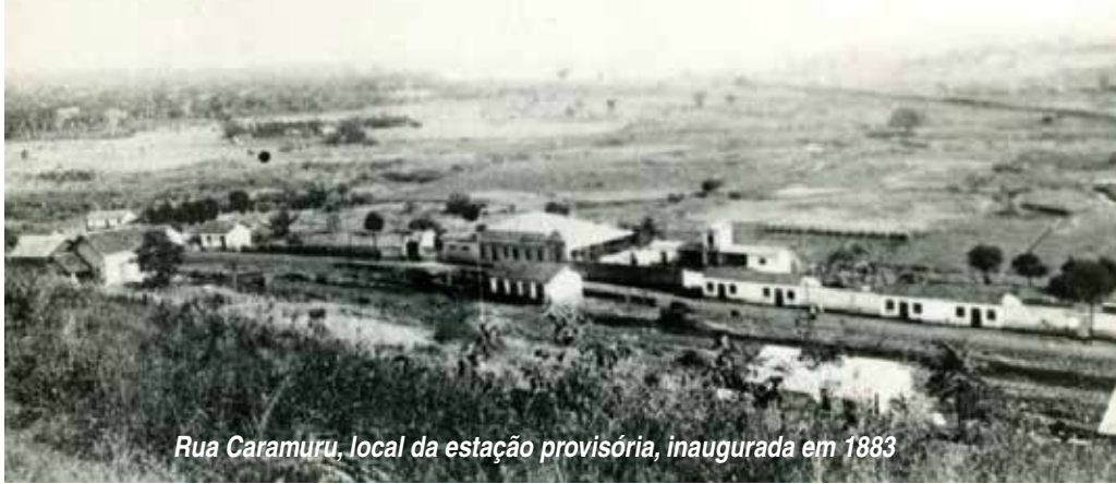
Rua Caramuru, local da estação provisória, inaugurada em 1883

Os trilhos da Mogiana chegaram a Ribeirão em 1883 e, depois, até o seu ponto final, na altura da estação de Entroncamento, em 1886. Os trens de passageiros deixaram de circular pela linha no final de 1997.