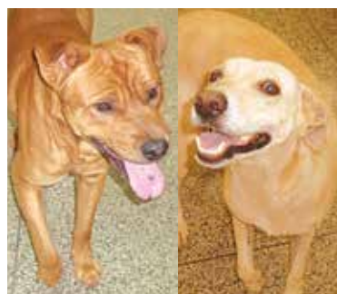
Rex e Branquinha

Ultimamente ela vem acompanhada por um companheiro, que já ganhou o nome de Rex. Elaine prepara um marmiteix abarrotado para cada um, e eles pedem bis.