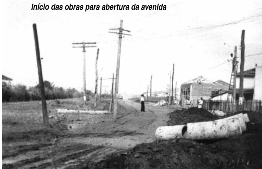
Início das obras para abertura da avenida

Mogiana, Antártica, Cerâmica, Banco Construtor, Igreja NS do Rosário? Copiamos e devolvemos e ainda publicaremos sua história no JV