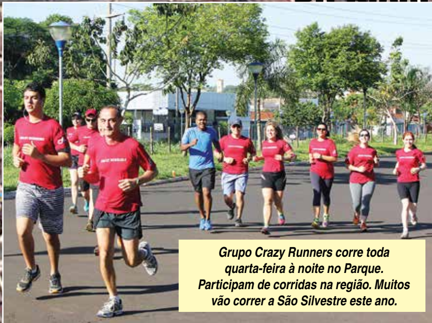
Grupo Crazy Runners corre toda quarta-feira à noite no Parque. Participam de corridas na região. Muitos vão correr a São Silvestre este ano.