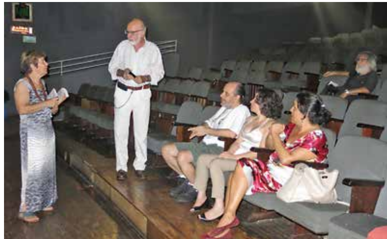
Bate papo com poucos privilegiados