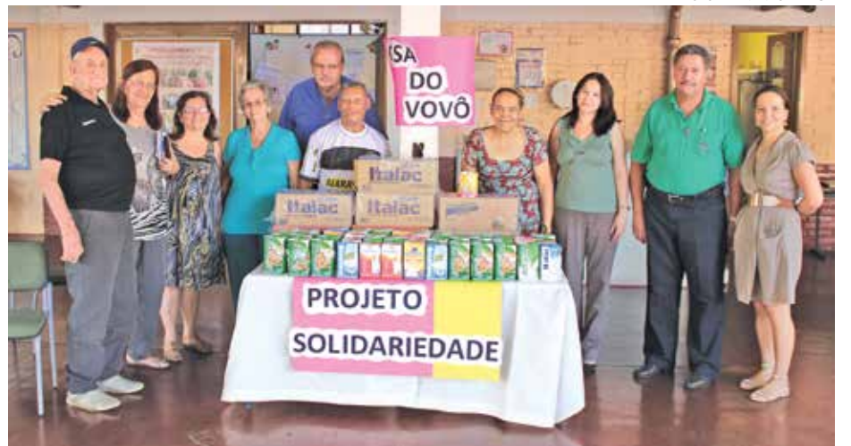
Direção da escola com representantes da Casa do Vovô