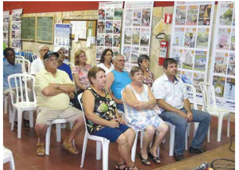
Uma pequena e participativa plateia assistiu a exibição. No fundo, exposição das capas: oito anos do Jornal da Vila

A próxima exibição do documentário será no salão da Igreja de Santa Luzia, em data a ser programada.