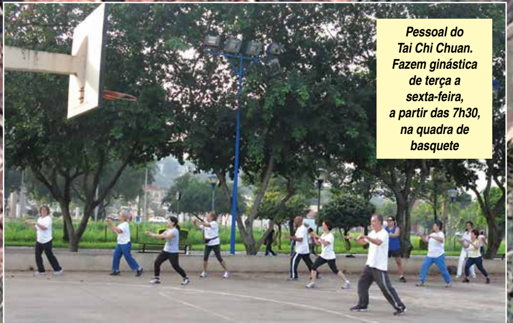
Pessoal do Tai Chi Chuan. Fazem ginástica de terça a sexta-feira, a partir das 7h30, na quadra de basquete