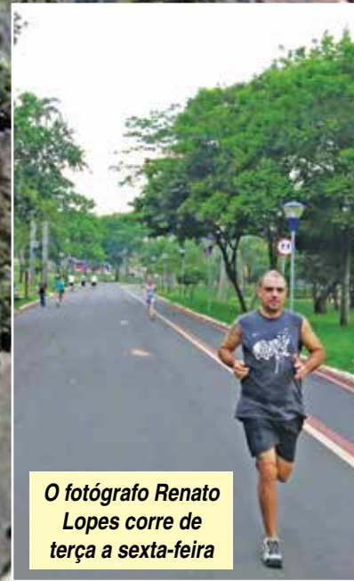
O fotógrafo Renato Lopes corre de terça a sexta-feira