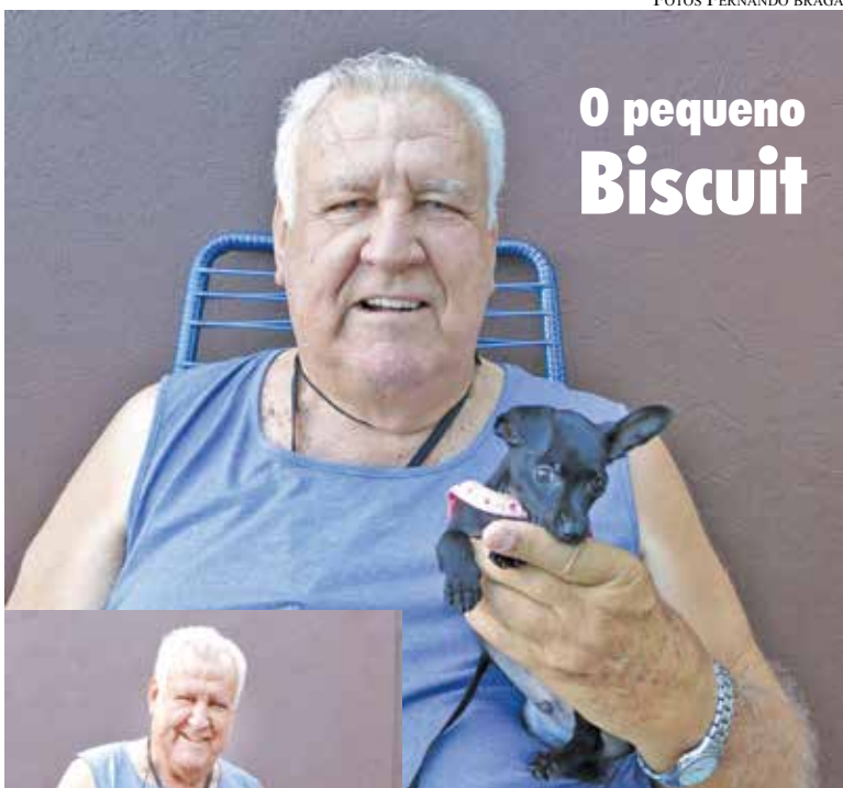
O pequeno Biscuit

Deve ter uma lista de espera, mas que compensa no final.