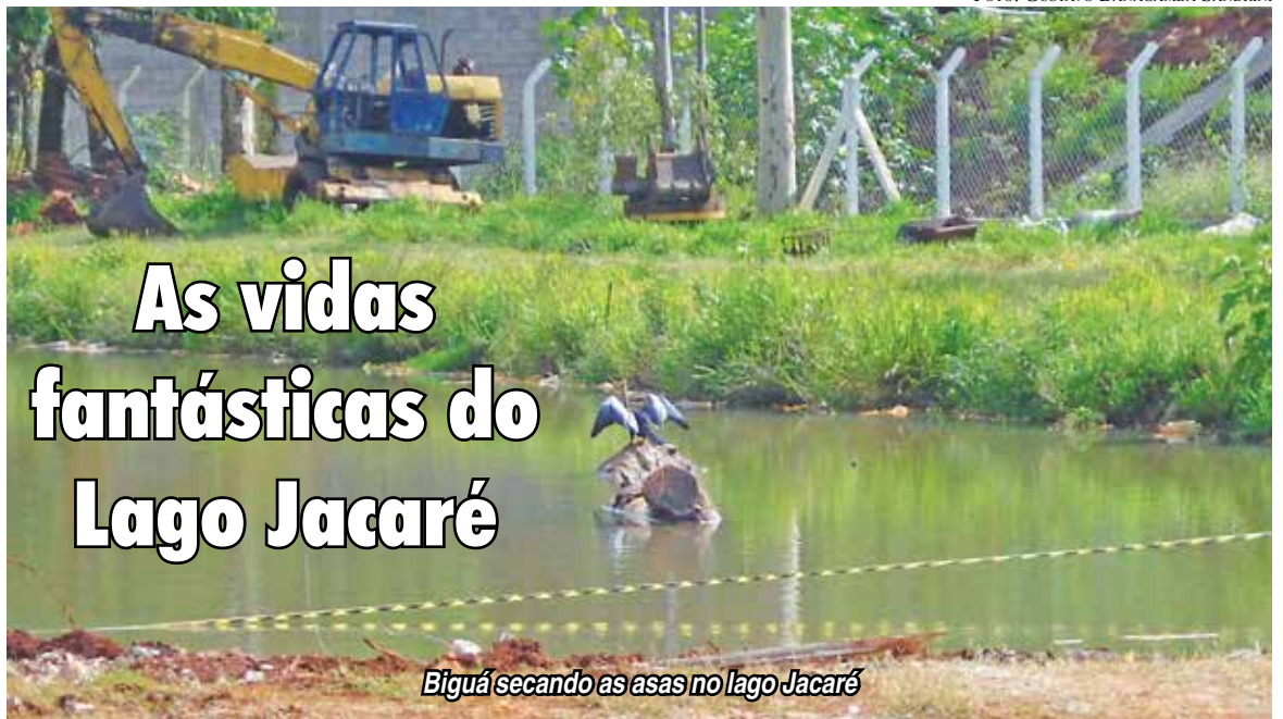
Biguá secando as asas no lago Jacaré

Os postes de iluminação da Avenida precisam ganhar "braços duplos". (FB)