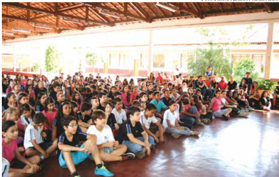
Alunos assistem as apresentações

doadas com muito carinho pela comunidade escolar.