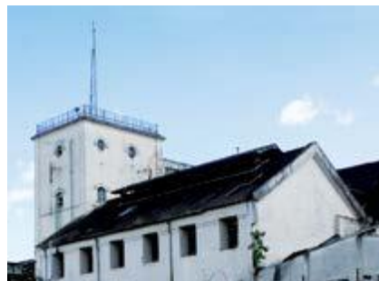
Construções que serão preservadas: caixa d'água, local onde se fabricava as cervejas (acima) e edifício na esquina da Luiz da Cunha com o antigo leito dos trilhos