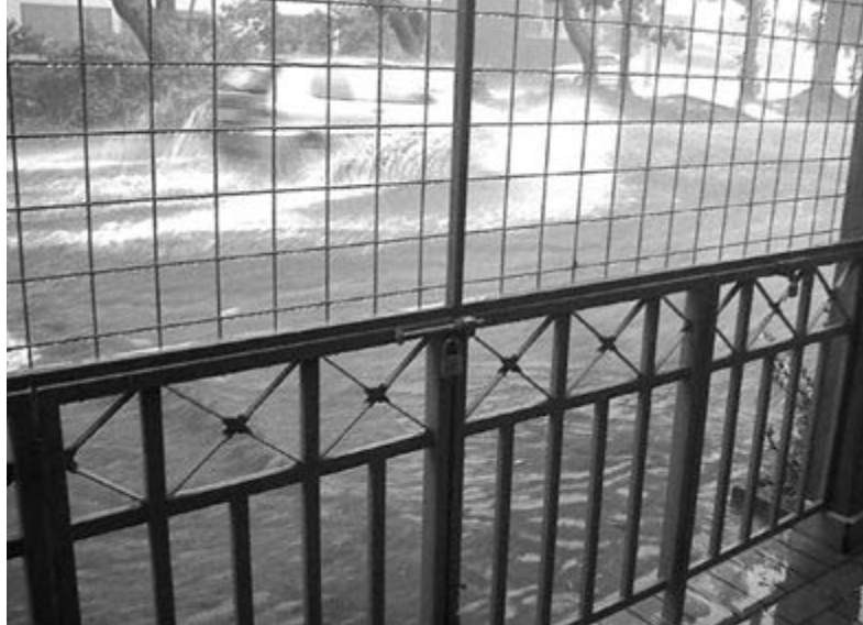
Enxurrada na Avenida do Café, vista da Choperia Invicta

Muitas ruas da Vila Tibério ficam alagadas nos dias de chuvaram. A Avenida do Café fica intransitável.