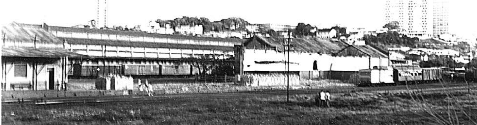
Galpões da Mogiana onde hoje fica o Parque Maurílio Biagi. Foto de 5 de maio de 1969 feita por Paulo Chicaneli