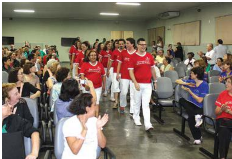
tomSete - regência Gustavo Carluccio