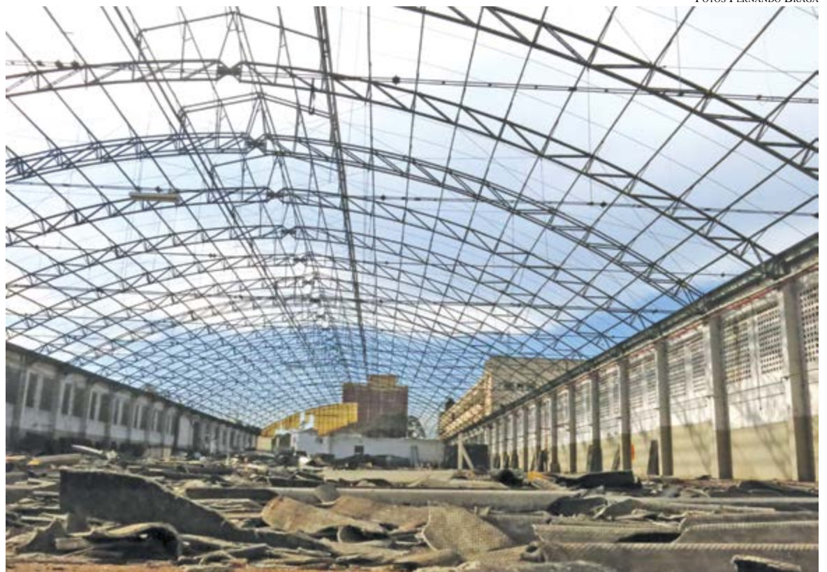
Galpão, usado como depósito, já totalmente destelhado