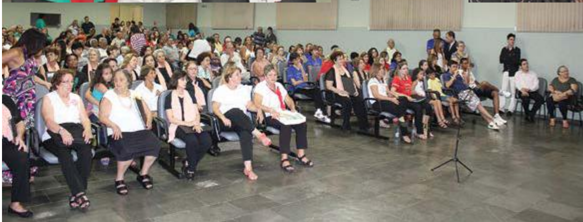
O público lotou o salão paroquial