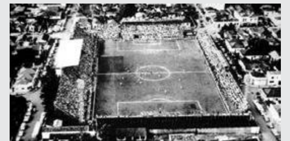
Em 2011 o Poliesportivo foi vendido em um leilão judicial por conta de uma dívida trabalhista.

No terreno onde antes ficava o estádio, passou a funcionar o Poliesportivo do Botafogo. A história do estádio foi preservada em parte, pois uma arquibancada foi mantida intacta durante a demolição.